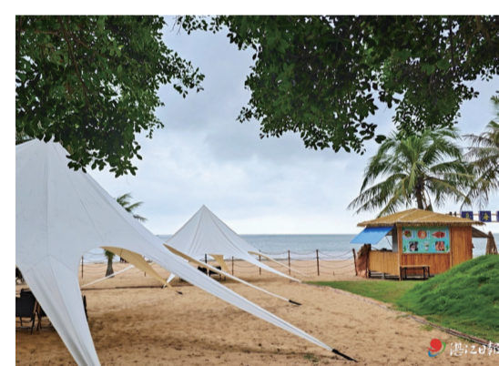
休閒舒適的白沙灣海岸。

目前，海安鎮充分挖掘資源稟賦，依托白沙灣等資源優勢，打造海洋漁業、加工貿易、休閒旅遊為一體的一二三產業融合發展示範帶。