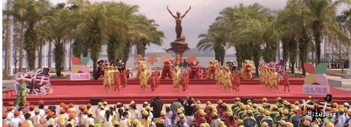
6月3日，央視少兒頻道（CCTV14）播出《大手牽小手——走進湛江》第六期節目。（央視節目視頻截圖）